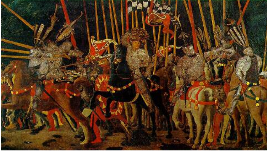
پاولۆ ئۆتشیللو Paolo Uccello

هونەری ئەوروپی سەدەکانی ناوەراست و رینسانس ٢٦٩